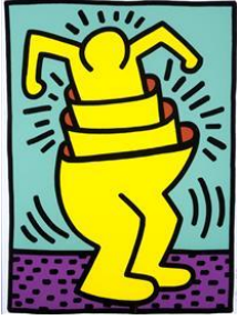
Keith HARING, Sans titre, 1989