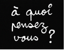
BEN, Phrases diverses, années 1980-90