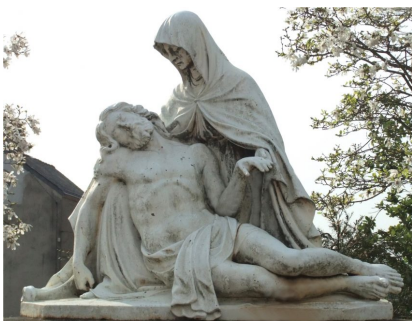
MAM de Saint-Herblain