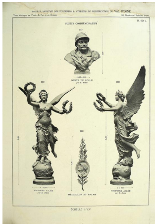
Planche du catalogue de la fonderie Val d'Osne, 1921