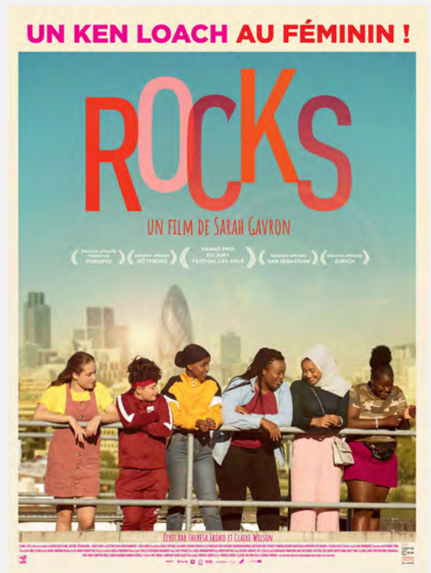
ROCKS Collège et Lycée