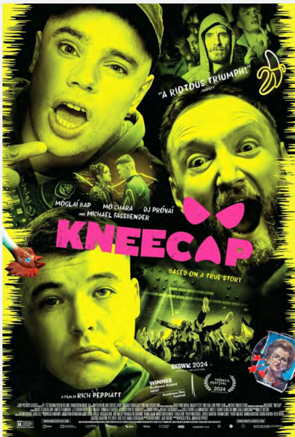
KNEECAP Collège et Lycée