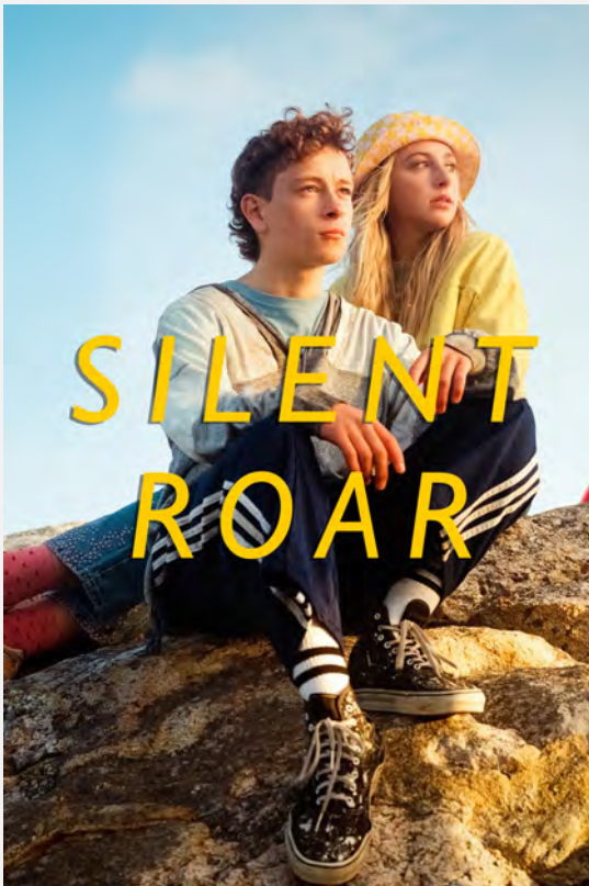
SILENT ROAR Collège et Lycée