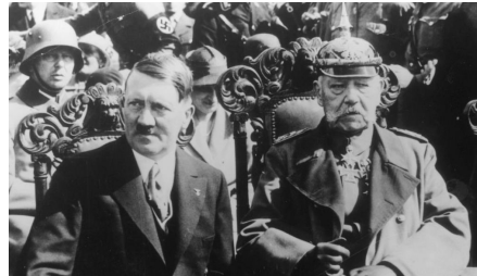
Hitler diventa cancelliere :