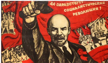
Rivoluzione russia :