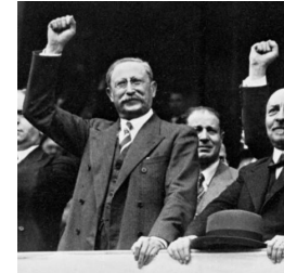
Vittoria di u Fronte popolare :